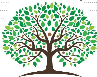
L'héritage de Félix Houphouët-Boigny