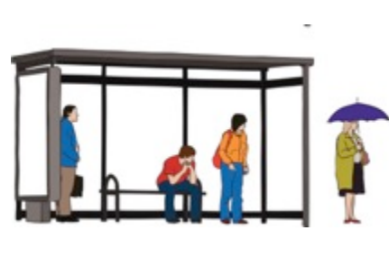
UNE PERSONNE DANS LA RUE