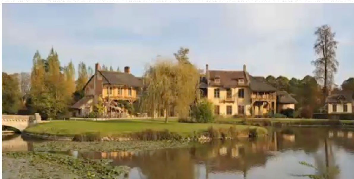
LE DOMAINE DE MARIE-ANTOINETTE