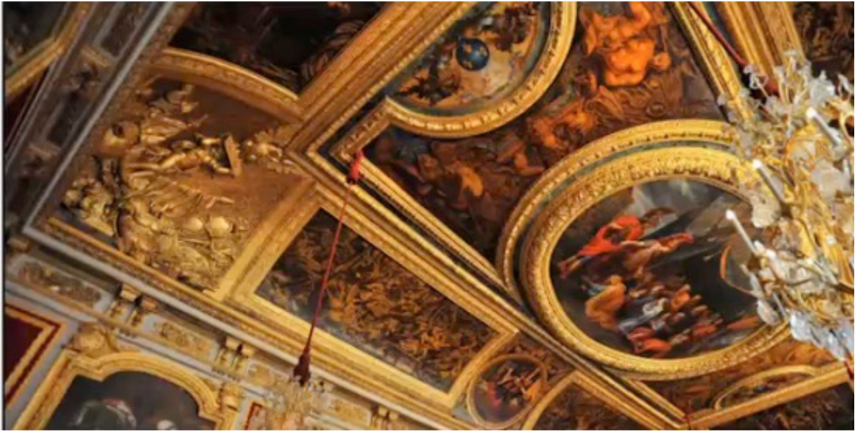
LES GRANDS APPARTEMENTS