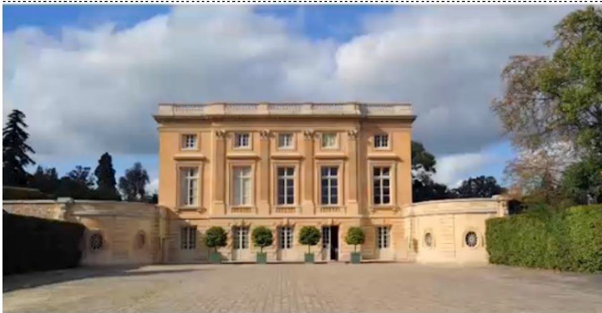
LE DOMAINE DE MARIE-ANTOINETTE