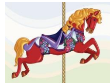
Un cheval de bois