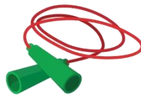
Une corde à sauter