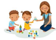
Un jeu de société