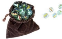
Un sac de billes