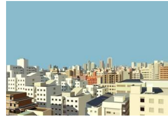
Dans une grande ville