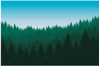
Dans la forêt

→ Activité 2 : écoute le début de la chanson. À ton avis, où est-ce qu'on est ?