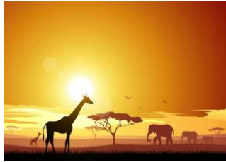
Dans la savane