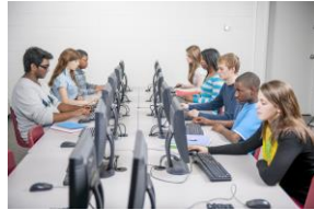
Une salle informatique