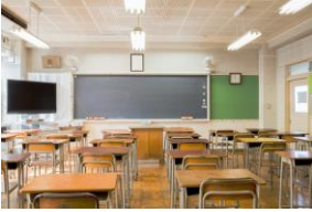
Une salle de classe

→ Activité 1 : regarde le début du clip. Barre le nom des lieux du collège que tu ne vois pas dans le clip.