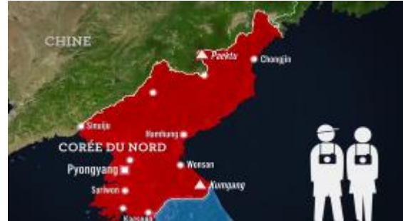
6. Le tourisme