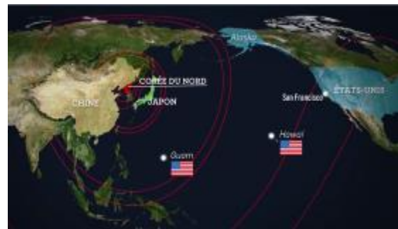
4. Les missiles à moyenne et longue-portée