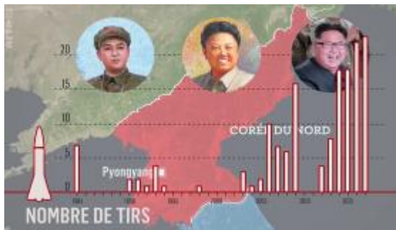
3. Le développement des missiles