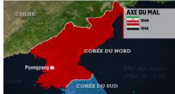
2. L'axe du mal