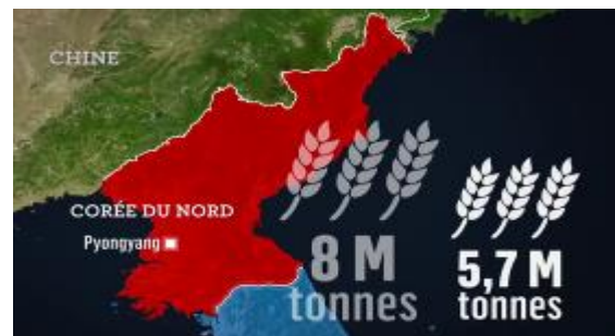
8. La production de céréales