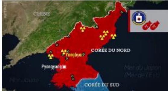
1. Les sites nucléaires