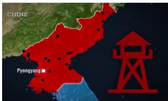
9. Les camps