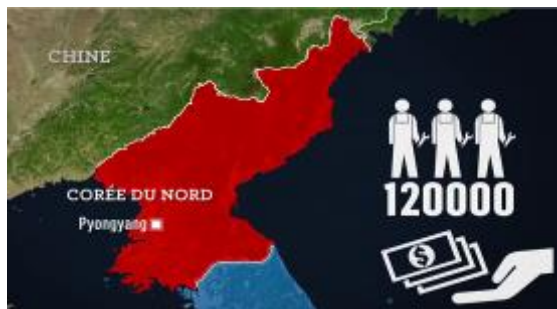
7. Les travailleurs